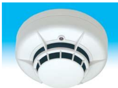
Рис. 3.2 Комбінований пожежний извещатель Іп212/101-2-а1г

Сумісність практично з будь-якими пожежниками приймально-контрольними приладами (ПКП), у тому числі і із знакозмінною напругою в шлейфі сигналізації,