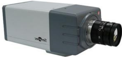
Рис.3.8 Кольорова мегапиксельная відеокамера STC-IPM2090A з об'єктивом, аудіоканалом і дозволом до 1280x1024 пикс.

Малогабаритна IP-відеокамера STC-IPM2090A мазкі Smartec використовує високоякісну 1,3-мегапиксельную КМОП-матрицю з чутливістю до 0,5 лк, яка формує інформативний відеосигнал з дозволом до 1280x1024 пикс. Цифрові відеопотоки у форматах MPEG-4 або M-JPEG ця мегапиксельная відеокамера може передавати по IP-сеті з дозволом від 640x480 до 1280x1024 пикс. і частотою від 30 до 8 к/с, відповідно, а також дозволяє організувати аудіозв'язок між оператором і об'єктом відео спостереження через аудіо-вхід/вихід. Окрім цього відеокамера оснащена мегапиксельным об'єктивом 4,2 мм, детектором руху з чутливістю, що налаштовується, і тривожними входом/виходом, а також підтримує технологію POE. STC-IPM2090A комплектується русифікованим ПО NVR на 32 відеоканали і сумісна з ПО XProtect компанії Milestone.