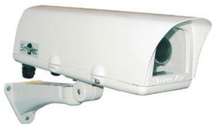
Рис.3.9 Універсальні термокожухи Smartec серії STH-1230

Термокожухи Smartec серії STH-1230 мають ступінь пилю- і вологозахисту IP66 і призначені для захисту камер відеоспостереження при їх роботі у вуличних умовах. Моделі цієї серії з одним обігрівачем забезпечують діапазон робочих температур від -40о до +50оС, а з двома обігрівачами – від -55о до +50оС. Також випускається модифікації з імпульсним джерелом живлення і без нього. У пристроях цієї серії верхня кришка відкривається повністю, що забезпечує вільний доступ до камери, яка розташовується на кріпильній пластині з можливістю регулювання її положення.