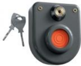
Рис.3.5 ІО-101-2 "КНФ-1" (НИЦЬ Охорона)

Ізвещатель ІО-101-2 "КНФ-1" (кнопка тривожної сигналізації), що встановлюється на об'єкті, призначений для організації тривожного сигналу на об'єктовий прилад приймально-контрольний (ППК). До складу ІО-101-2 "КНФ-1" входить мікроперемикач. При спрацьовуванні кнопки (розмикання контактів мікроперемикача) на вході ППК відбувається розрив шлейфу сигналізації. Повернення в початкове положення можливе тільки за допомогою ключа і замку.