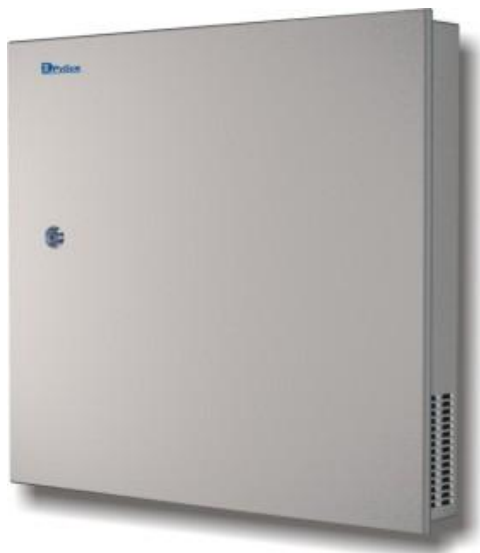
Рис.3.1 Загальний вид ППКОП 01059-100-4 «Р-060»