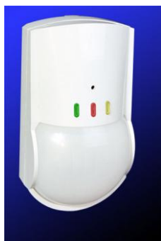
Рис.3.3. Извещатель охоронний поверхневий суміщений «ОРЛАН» (Io315-1)