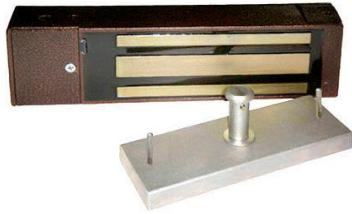
Рис. 3.7 ML-194 К (Б/е) NEW електромагнітний замок

автоматики пожежних і запасних виходів, а також в приміщеннях, де пред'являються найжорсткіші вимоги Електромагнітні замки серії ML-194К призначені для використання в системах контролю доступу і до виконавчого механізму: